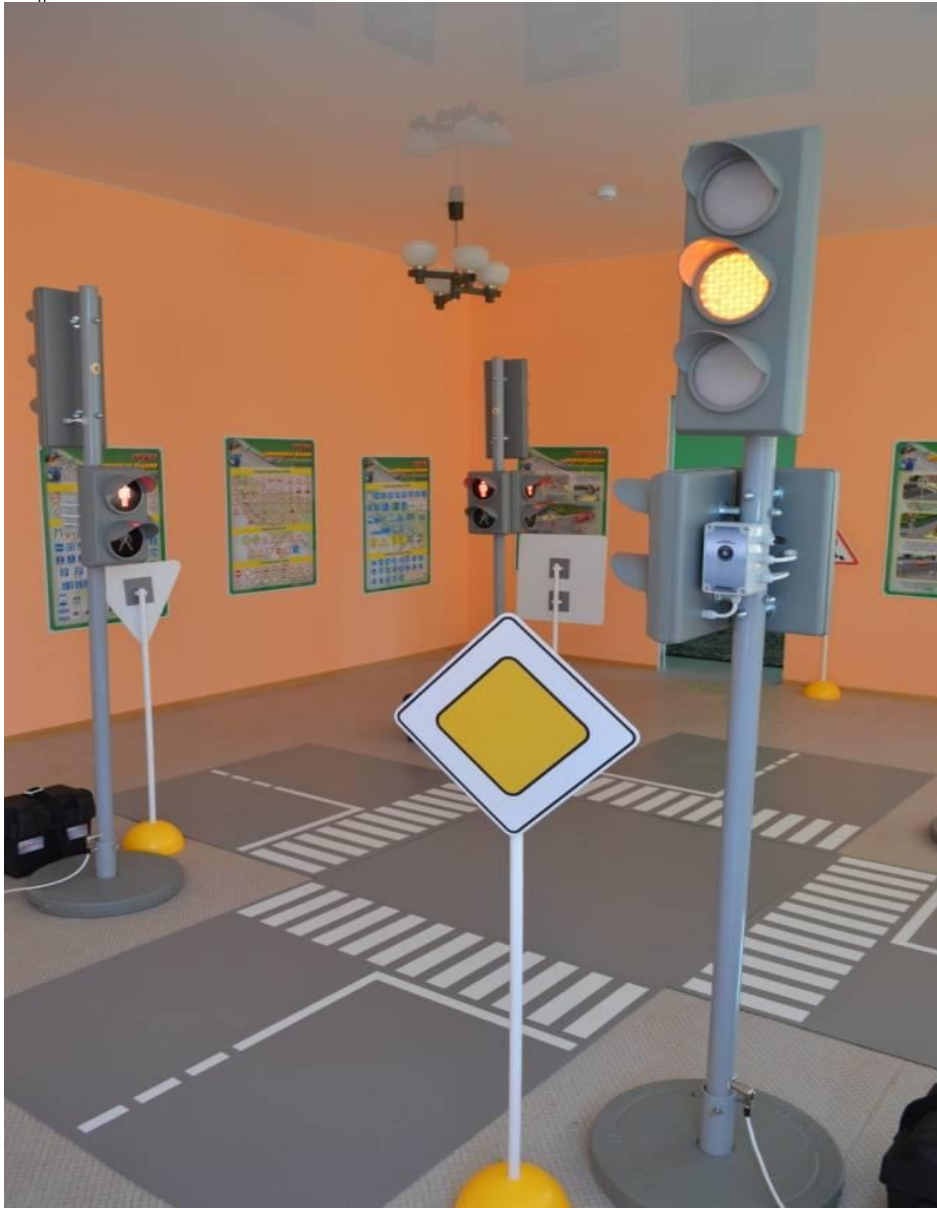
Фото на странице: 0