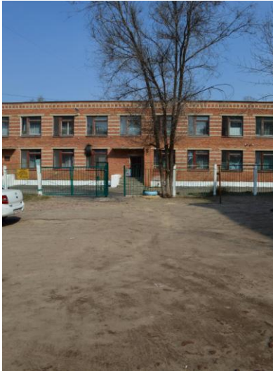
Подход к ОУ со стороны улицы Колхозной