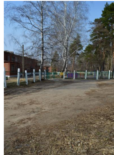
Подход к ОУ со стороны улицы Советской