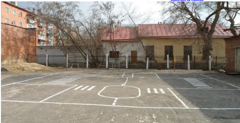
Фото на странице: 1