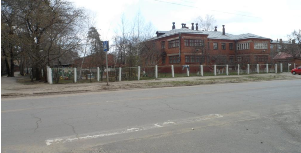
Фото на странице: 2